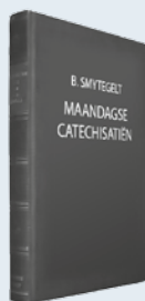
ds. B. Smytegelt Uit: "Maandagse Catechisatiën"