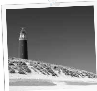
Vuurtoren van Texel

Compleet ingerichte 6-8 pers. Lodgetenten. Direct aan het Lago- Maggiore (Italië) of bij de Friese meren. Boek nu uw vakantie. www.familylodges.nl 0343-481155