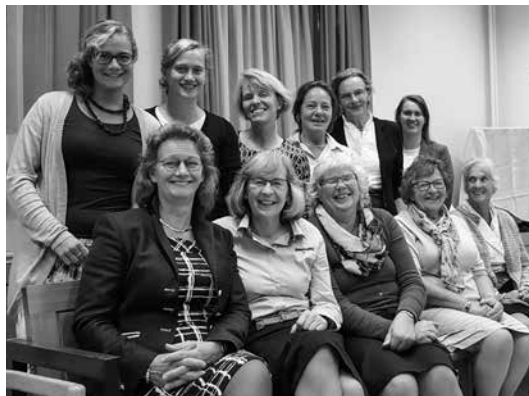
Het synodeteam uit oktober 2016.