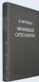
ds. B. Smytegelt Uit: "Maandagse Catechisatiën"

De Heere roept nog uit het diensthuis van de zonde. Smeek om dat trekkende werk van Zijn Geest. Bij de Heere zijn uitkomsten, zelfs tegen de dood. Hij maakt waar: 'Het volk dat in duisternis wandelt, zal een groot licht zien; degenen die wonen in het land van de schaduw des doods, over dezelfde zal een licht schijnen.'