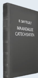
ds. B. Smytegelt Uit: "Maandagse Catechisatiën"

Beproof vrij, van omhoog Mijn hart, dat voor Uw oog, Alwetende, steeds openlag. Doorzoek mij; toets mijn gangen; Doorgrond al mijn verlangen, En stel mijn oogmerk in den dag. (Psalm 26:2)