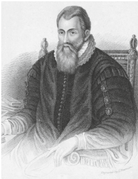
John Napier (1550-1617)

E indtijdvoorspellingen zijn er altijd geweest. Begin deze maand verscheen een artikel in het Reformatorisch Dagblad over John Napier, een Schotse wiskundige (1550-1617). Hij schreef een commentaar op het Bijbelboek Openbaring dat werd uitgegeven bij een bekende drukker van puriteinse boeken. Napier beweerde dat Christus spoedig zou wederkomen tussen 1688 en 1700.