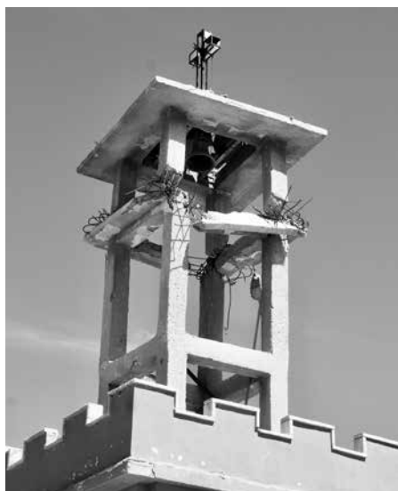
Kapot geschoten klokkentoren van een christelijke kerk in de buurt van Mosul.