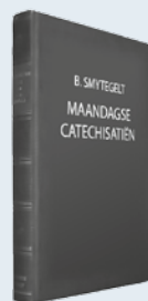
ds. B. Smytegelt Uit: "Maandagse Catechisatiën"

In het Woord is Hij hen geopenbaard. Door het geloof hebben zij Hem aanschouwd en in de beloften soms ontvangen en dat doet hen in heilig verlangen uitzien naar de dag dat ze hun wens verkrijgen zullen. O, mocht dit voor die van verre staande en bekommerde zielen eens waar worden. Voor zo menigeen staat de schuld nog open, is de vrede dikwijls zo ver, waarvan de engelen hebben gezongen. Och, of zij komen mochten tot Hem, de Vrededorst, de Wens aller heidenen, om door vereniging des geloofs met Hem de vrede voor hun zielen te verkrijgen. O, mocht Zijn komst in uw ziel zó verbeid worden. Welnu, is dan de Wens aller heidenen ook uw wens, uw verlangen en uw uitzien? Godvruchte schaar, houd dan eens moed. Hij is getrouw, de bron van alle goed. Zo daalt Zijn kracht op u in zwakheid neer; Wacht dan, ja wacht, verlaat u op de Heer.