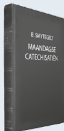
ds. B. Smytegelt Uit: "Maandagse Catechisatiën"