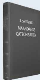
ds. B. Smytegelt Uit: "Maandagse Catechisatiën"

Er is een doorgaand genadewerk in het leven van de gelovigen. Ze leren steeds dieper verstaan hoe boos en verkeerd de oude mens der zonde is. Die oude mens wordt nooit bekeerd. Het is een moeilijke, maar zeer noodzakelijke les om te leren dat er alleen vruchten zijn als er water is. Alleen water maakt het Sittimdal vruchtbaar. Alleen in de gemeenschap met Christus kan er sprake zijn van vruchtdragen. 'Uw vrucht is uit Mij gevonden' (Hos. 14:9). Dan opent de Pinkstergeest uw mond om te belijden: Jezus alléén is mijn gerechtigheid voor God. Jezus alléén is mijn heiligheid voor God. Christus is álles. Ja, kom, Heere Jezus. Amen.