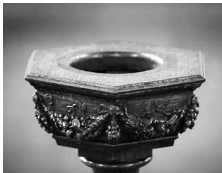
Bij onze doop werd al gezegd: 'dat Hij in ons wonen en ons tot lidmaten van Christus heiligen wil...'

Die Geest maakt altijd plaats voor Christus. 'Die zal Mij verheerlijken, want Hij zal het uit het Mijne nemen, en u verkondigen.' Als Gods Geest een zondaar van dood levend maakt, leert hij dat hij van nature geen deel heeft aan Christus en Zijn weldaden, en er zichzelf ook geen deel aan kan geven. Hij staat er buiten en dat door eigen schuld. Dat doet schuld bewenen en belijden voor Gods aangezicht. En hoe