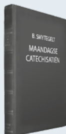
ds. B. Smytegelt Uit: "Maandagse Catechisatiën"