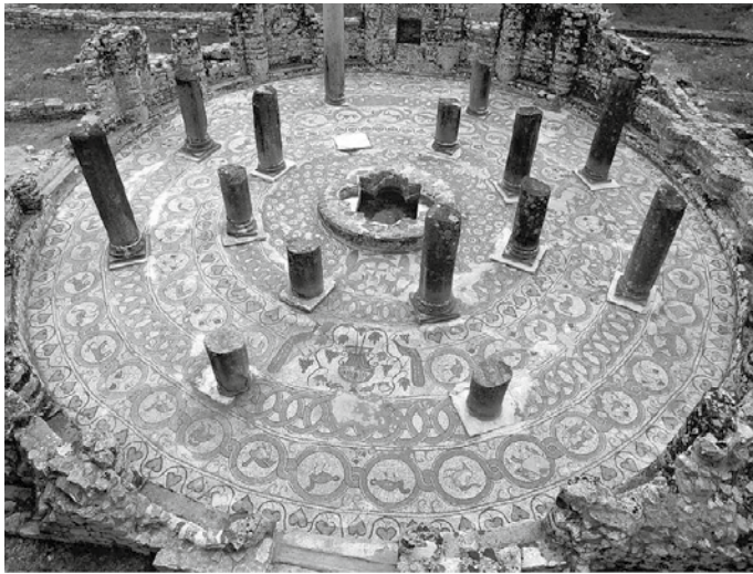
Doopkapel Butrint (6e eeuw)

Vermoedelijk is de apostel Paulus in het Albanese deel van Illyricum geweest om het Woord te prediken. Albanië heeft een prachtige natuur, kent hoge bergen en grillige kusten. Met zijn 3,6 miljoen inwoners is het land dunbevolkt.