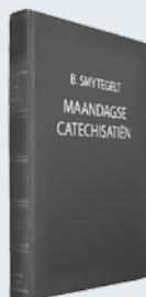
ds. B. Smytegelt Uit: "Maandagse Catechisatiën"

Een dag van heilig berusten Vreemd vuur brengen voor Gods aangezicht: dat loopt verkeerd af. Wat moeten we toch beducht zijn voor onheilig vuur! Zeker, ook lauwheid in de dienst des Heeren is een groot gevaar. Denk maar aan Eli. Er is echter ook een valse ijver, een Jehu's ijver. Eigenwillige godsdienst betekent: Gods werk doen op onze wijze. Wie komt er zonder schuld uit? Wie zou niet vrezen? Straft de Heere dan altijd meteen? Nee. Soms stelt Hij het oordeel uit. Hij strafte wel meteen bij Achan, toen het volk op het punt stond Kanaän binnen te trekken. Hij deed het ook bij Ananias en Saffira, toen de gemeente van het Nieuwe Testament was geboren. Hier doet Hij het onmiddellijk na de instelling van de offerdienst. Hij stelt daarin een teken. Hij geeft een ernstige waarschuwing. En Aäron? Hij mocht ermee onder God komen. Nadab en Abihu waren door het vuur verteerd. 'Doch Aäron zweeg stil' (vs. 3). Hij heeft de begrafenis van zijn jongens niet bijgewoond. Hij was in het heiligdom en hij bleef daar. Hij stond aan Gods kant. Helemaal aan Zijn kant. Daar brengt alleen de liefde Gods. En zo komt God aan Zijn eer. In recht en in genade. De dichter zei: 'Ik zal van goedertierenheid en recht zingen' (Ps. 101:1). Mag u het hem nazeggen?