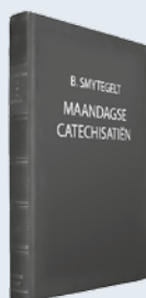
ds. B. Smytegelt Uit: "Maandagse Catechisatiën"