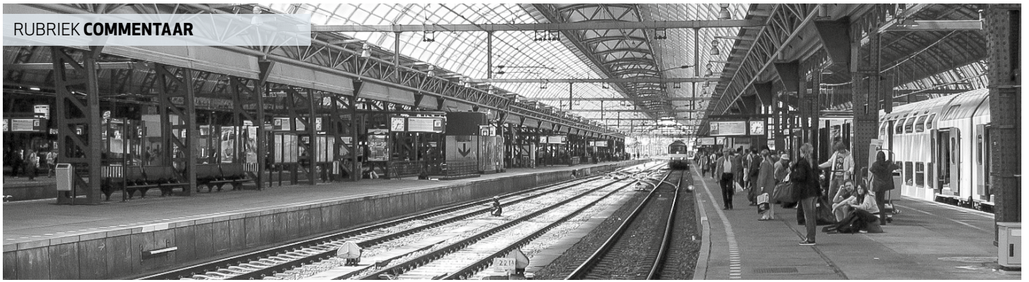
'Dames en Heren'. Dat zult u niet meer horen op de perrons van de NS.