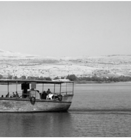
Meer van Galiléa.

Hier is een bron van ontfermende genade, want zó wordt de belofte vervuld: 'Ik heb U ook gegeven tot een Licht der heidenen om Mijn heil te zijn tot aan de einde der aarde.'