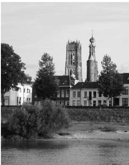
Het afscheid van Zaltbommel viel zwaar.