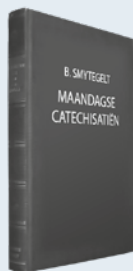
ds. B. Smytegelt Uit: "Maandagse Catechisatiën"