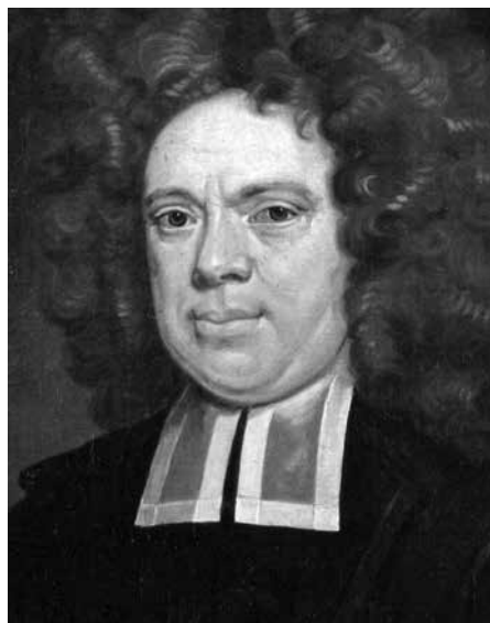
Matthew Henry 1662-1714

De Bijbelverklaring van Henry heeft iets eigens. Het is niet alleen uitleggend. Het is ook stichtend, meditatief. De dagelijkse omgang met de Schrift en het gebedsleven van Henry is bij het lezen te proeven.