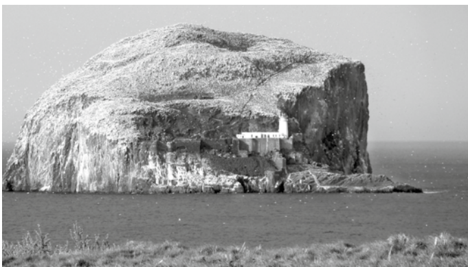
Het eiland Bass Rock.