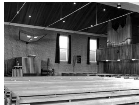
Het kerkgebouw te Werkendam vóór de verbouwing van 1967.