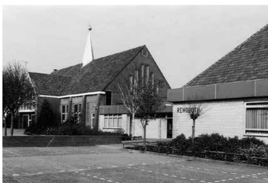
Het kerkgebouw te Dirksland.