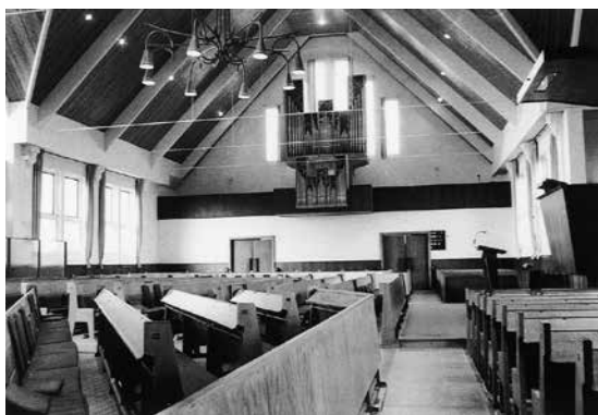
Het interieur van het kerkgebouw te Dirksland.