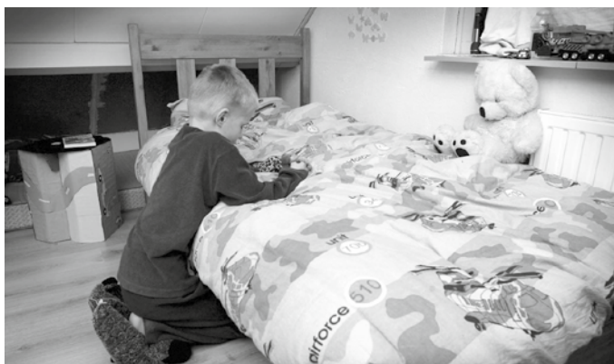
Handen vouwen, ogen dicht...

Tot Hem gebracht. 'Het blijkt niet dat zij genezing voor het lichaam nodig hadden. Maar het schijnt dat zij die hen verzorgden, zich in de eerste plaats aan hun ziel lieten gelegen liggen. Het heil van de zielen hunner kinderen behoort ook bij alle ouders boven alles te gaan. Want dat is hun voornaamste deel, en het is wel met hen, als hun ziel welvaart' (Henry). Bidden voor en met onze kinderen. Het is van het allergrootste belang. In eigen kracht echter onmogelijk. 'Heere, leer ons bidden.'