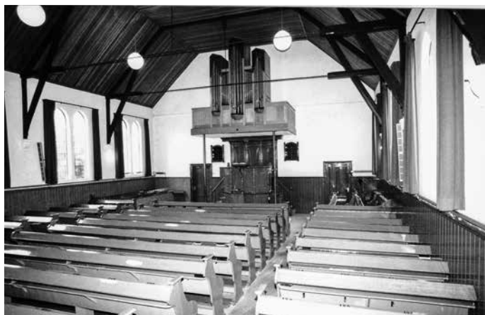
Het interieur van het kerkgebouw te Borssele.