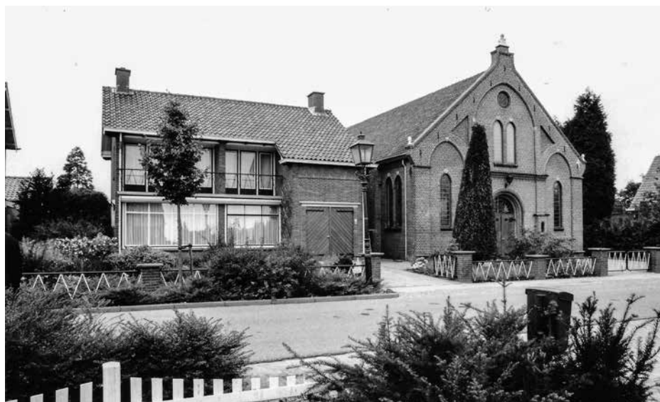
Kerk en pastorie te Borssele.