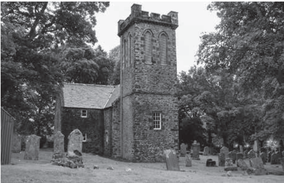
Thomas Boston en zijn vrouw kregen tien kinderen, van wie er zes op zeer jonge leeftijd stierven. Boston heeft ze zelf begraven, alle zes.

D e Schotse predikant Thomas Boston (1676-1732) wist wat lijden was, wat krommingen in het leven waren. Hij was, wat wij nu noemen, met recht een ervaringsdeskundige. Het ging hem niet alle dagen voor de wind. Zijn zorgen waren groot, zijn tegenspoeden vele.