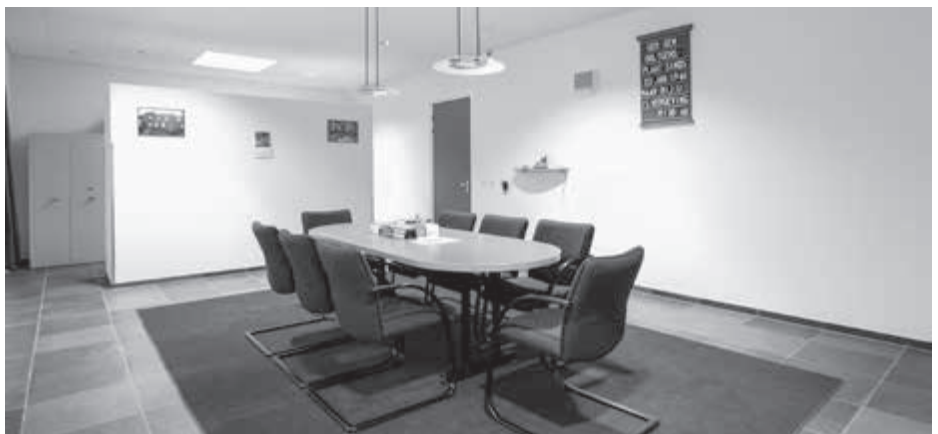
Het kerkelijk gezag berust bij de kerkenraad.

Wanneer een classis of synode gaat sluiten, dan wordt een gemeente aangevraagd als roepende kerk. Deze gemeente moet de volgende keer de betreffende classis (of synode) samenroepen. Dat wil zeggen dat de roepende kerk tegen die tijd aan de classisgemeenten vraagt of er agendapunten zijn. De agenda wordt samengesteld en aan de classisgemeenten gestuurd met de oproep voor de volgende vergadering op een bepaalde datum. Iedere kerkenraad vaardigt dan twee ambtsdragers af. Dat zijn de predikant en een ouderling of anders twee ouderlingen. Deze afgevaardigden vormen samen de classis. Op vergelijkbare wijze wordt ook een synode samengeroepen door de aangewezen roepende kerk. Onder leiding van de roepende kerk wordt de betreffende meerdere vergadering geopend en wordt het moderamen (het leidinggevende bestuur) gevormd. Vergadering en moderamen houden op te bestaan zodra de vergadering gesloten is. Een moderamen krijgt (meestal) de opdracht enige zaken uit te voeren waartoe de vergadering besloten heeft.