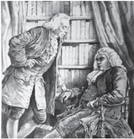
Comrie en Holtius bespreken het schrijven van het Examen van het ontwerp van tolerantie.

De zondaar beeft en siddert voor zijn Rechter. De aanklagers beschuldigen hem en brengen hem als een Mefiboseth aan Gods voeten.