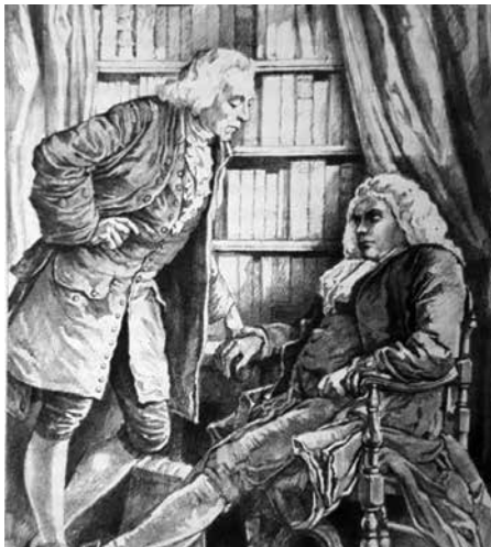
Comrie en Holtius bespreken het schrijven van het Examen van het ontwerp van tolerantie.

De rechtvaardigmaking maakt geen rijke christenen. Zij blijven in zichzelf armen, eenvoudigen. Maar dezen zijn het die God steeds gadeslaat, al voelen zij zich uitgeleerd, Hij ziet op hen neder. Horen we erbij? (slot)