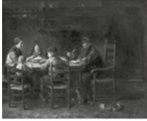
Orde in het gezin

"Orde in het gezin", Isaac Ambrosius; uitg. De Banier, Apeldoorn; 75 blz.; € 12,95.