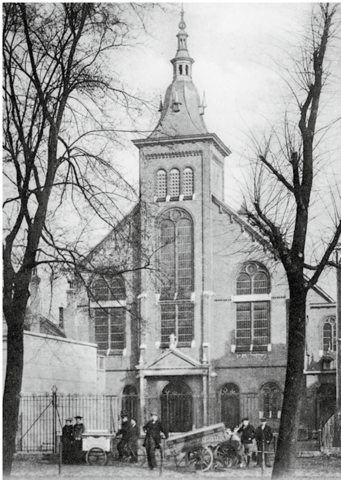
De Boezemsingelkerk omstreeks 1915.

M et weemoed wordt er op de jaren aan het Weenaplein teruggekeken. Zo vermelden de notulen: '...wordt deze laatste vergadering te dezer plaatse beëindigd, zo veelvuldig aan herinneringen en bemoeienissen des Heeren, waar sinds 11 september 1870 het Evangelie der Genade was gepredikt, waar onder de bediening des H. Geestes zondaars waren getrokken uit de duisternis tot Gods Wonderbaar licht, waar Gods arme volk opgebouwd zijn geworden in 't allerheiligst geloof, onder en door de bediening van verschillende Leeraars, waarvan de eene langer de ander korter tijd in de Gemeente gearbeid hebben. (...) En waar de Heere in Zijn liefde ons weer een ander plaatse der zamenkomste heeft verstrekt, mocht het dan wezen dat Hij verder een Toevlucht en Sterkte mocht zijn en krachtiglijk bevonden