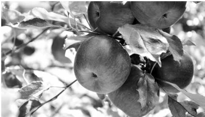
De vrucht van de appelboom is het gehemelte zoet.

Ook in de eerste helft van de negentiende eeuw, wanneer de beweging van het Réveil in ons land een belangrijke rol speelt, vooral in de steden Amsterdam en Den Haag, zien we belangstelling voor het Hooglied.