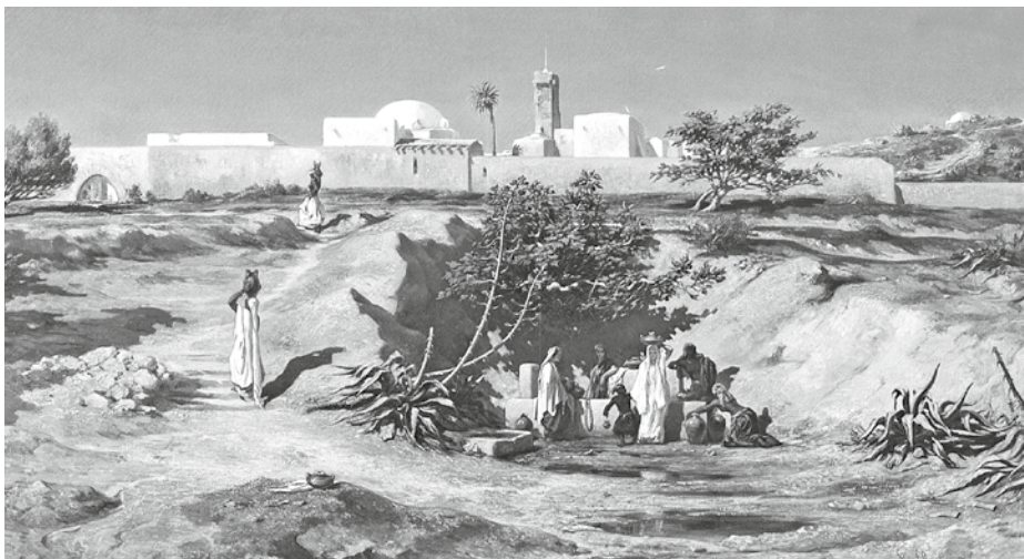
De eeuwige Zoon des Vaders heeft ‘onder ons gewoond’.