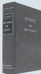
Uit: "Het zien op Jezus" Isaac Ambrosius (uitg. Den Hertog).

We zien haar gaan naar de stad. Ze geeft getuigenis van Gods werk en van de vrucht op Christus' werk. Nee, door geen vrees gestoord, maar door (liefdes)ijver aangespoord.