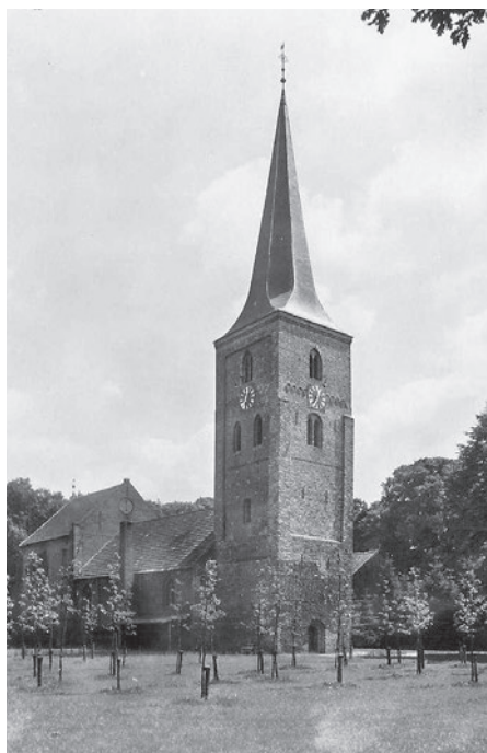
Veel mensen vinden dat de kerk geen antwoord geeft op hun vragen.

Dat de kerk steeds minder populair wordt, is geen wonder. De Heere Jezus is er heel helder over in Johannes 15, waar het gaat over de haat van de wereld. En in een bredere context spreekt de Bijbel duidelijke taal als er in Romeinen 3 staat dat er niemand is die God zoekt. Zeker niet in een tijd waarin de autonome mens zich uitleeft naar eigen zin en mening. Juist dan komt naar voren dat de gezonde leer niet meer wordt verdragen, maar dat men zich afwendt van de waarheid. Inmiddels zijn er ook veel kerken die een meer maatschappelijke rol op zich nemen. Je zou verwachten dat dit voor enige po-