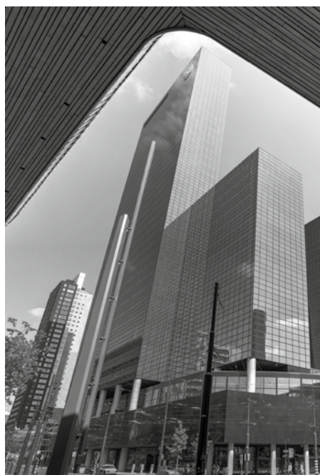
De schuldenlast van de westerse wereld bepaalt ons bij de geestelijke crisis waarin we verkeren.

Laat ons niet vergeten dat de Europese schulden zich op vergelijkbare wijze ontwikkelen. Afgesproken begrotingsregels worden veelvuldig overtreden. Het is een bedenkelijk patroon dat de gehele westerse wereld aangaat. De gevolgen kunnen op de lange duur niet uitblijven. Meestal