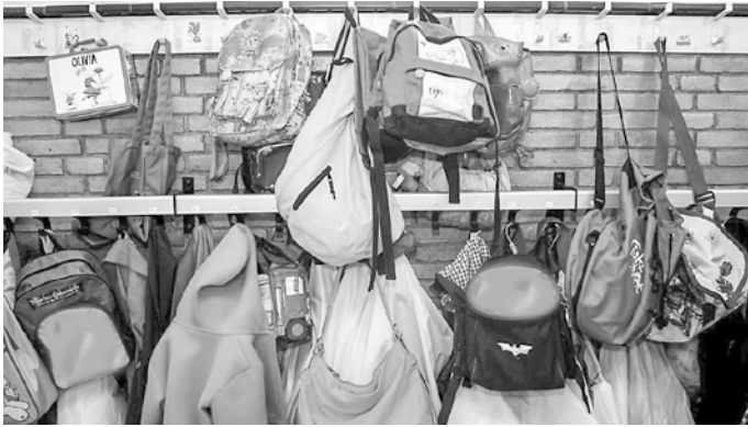
Werkgroep Onderwijs van het deputaatschap KGJO

‘De jeugd heeft de toekomst’, wordt weleens gezegd. Kinderen hebben een heel leven voor zich, vol ontdekkingen, uitdagingen, ontwikkeling en groei. Ze beginnen aan een enerverende reis: een zoektocht naar wie ze zijn en naar wie ze gaan, worden voor deze tijd, maar bovenal in het licht van de eeuwigheid. En wat is er mooier dan een stukje van die reis te mogen meebeleven en een bijdrage te mogen leveren aan die ontwikkeling?