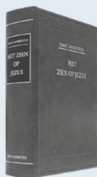
Uit: "Het zien op Jezus" Isaac Ambrosius (uitg. Den Hertog).

Zo was het ook met Lydia, 'welker hart de Heere heeft geopend' (Hand. 16:14). Hij, Die eerst de Schriften opent, opent daarna ook de harten. 'Hij is het waarachtige Licht, Hetwelk verlicht een iegelijk mens, komende in de wereld' (Joh. 1:9). Hij verlicht een iegelijk gelovige, niet alleen met een algemeen natuurlijk licht, maar met een bijzonder bovennatuurlijk licht, van zaligmakende, geestelijke en krachtige kennis.