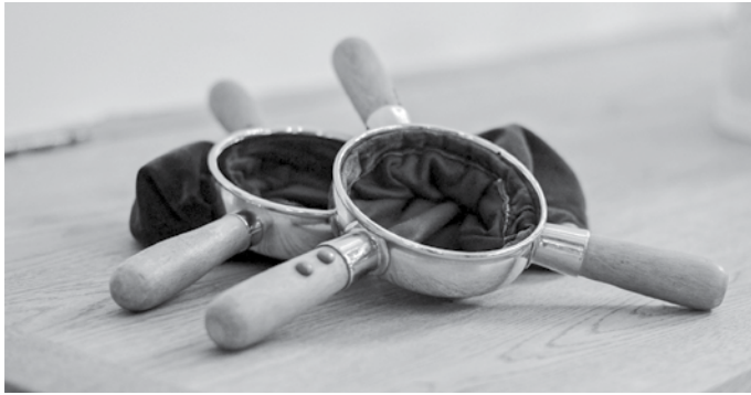
A. Bel, Vlaardingen

Over collecten is veel geschreven in De Saambinder , in artikelen over kerkrecht en over de eredienst. Heel vaak ging het ook om collecten voor een bepaald doel die vriendelijk doch dringend onder de aandacht gebracht werden.