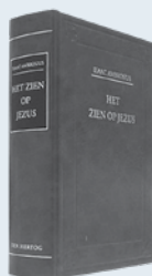
Uit: "Het zien op Jezus" Isaac Ambrosius (uitg. Den Hertog).