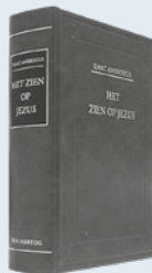
Uit: "Het zien op Jezus" Isaac Ambrosius (uitg. Den Hertog).