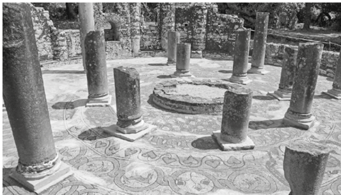
Het baptisterium van Butrint

In de brief aan de Romeinen schrijft de apostel Paulus dat hij ‘van Jeruzalem af en rondom tot Illyricum toe het Evangelie van Christus vervuld heeft’ (Rom. 15:19). Illyricum is onder meer het huidige Albanië.