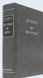
Uit: "Het zien op Jezus" Isaac Ambrosius (uitg. Den Hertog).