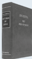
Uit: "Het zien op Jezus" Isaac Ambrosius (uitg. Den Hertog).