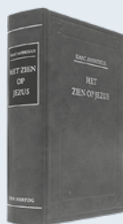
Uit: "Het zien op Jezus" Isaac Ambrosius (uitg. Den Hertog).