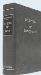
Uit: "Het zien op Jezus" Isaac Ambrosius (uitg. Den Hertog).