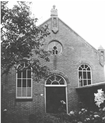
Het kerkgebouw van de Gereformeerde Gemeente te De Rijp.

Vader en zoon samen in de kerkenraad? 'Op sommige plaatsen is dit moeilijk te ontgaan en geheel te verbieden is het dan