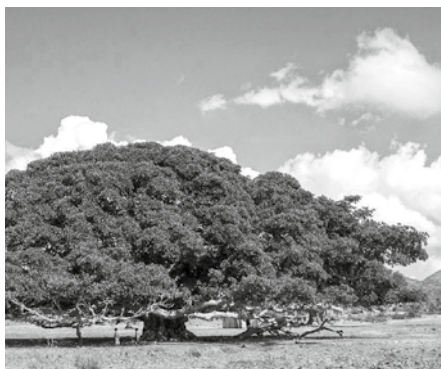
Onder de vijgenboom (Joh. 1:48).

Is dit bezwaar terecht? Calvijn leerde al tweeërlei kinderen des verbonds. Een eeuw later heeft de Westminster Confessie de gereformeerde verbondsleer beleden en samengevat. Volgens deze belijdenis gaat de nodiging tot de zaligheid uit naar alle hoorders, maar komt de belofte alleen toe aan degenen die tot het leven verordineerd zijn (Westminster Confessie VII §3).