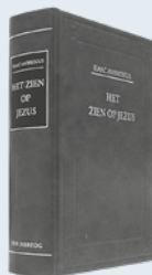
Uit: "Het zien op Jezus" Isaac Ambrosius (uitg. Den Hertog).