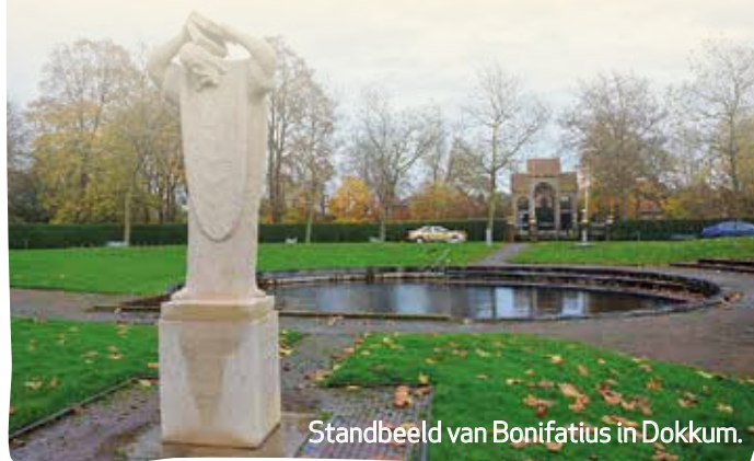
Standbeeld van Bonifatius in Dokkum.

Wil jij ook zo'n zendeling of evangelist als Bonifatius zijn? Als je jong bent, mag je al bidden of de Heere je in Zijn dienst wil gebruiken!