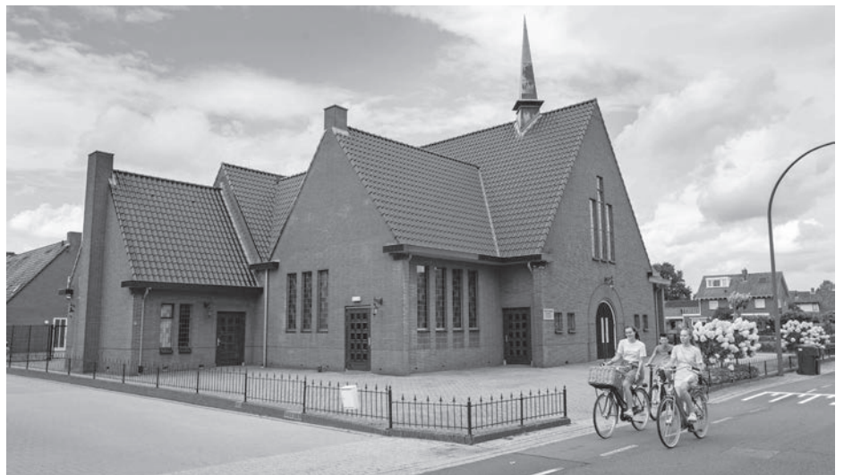
Karakteristieke kerk aan de Nachtegaalweg.