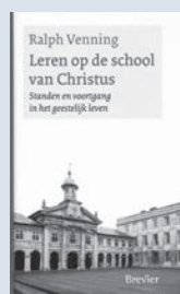
Uit: "Leren op de school van Christus", Ralph Venning (uitg. Brevier).