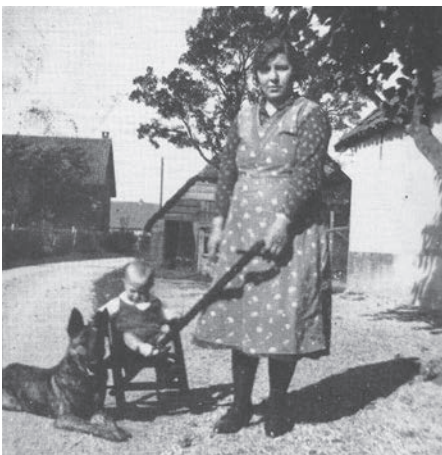
Van het eerste kerkje (links op de foto) zijn slechts twee (onduidelijke) afbeeldingen bekend. Het werd binnen 20 jaar afgebroken.