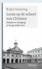
Uit: "Leren op de school van Christus", Ralph Venning (uitg. Brevier).