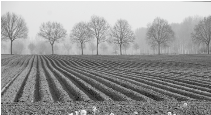
Sion ligt als een akker geploegd.

O zeker, hoe donker het op de wereld, in de kerk en in ons eigen hart en huis mag zijn, God zal altijd een overblijfsel behouden naar de verkiezing der genade. Maar wie geen vreemdeling is van eigen hart en leven, zal met biddag beschaamd en verlegen moeten zijn voor God en mensen. De alwetende God weet volmaakt hoe arm en leeg wij zijn in onszelf, dat wij biddeloze bidders en zuchteloze zuchters zijn.