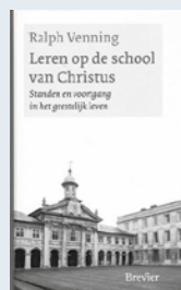
Uit: "Leren op de school van Christus", Ralph Venning (uitg. Brevier).