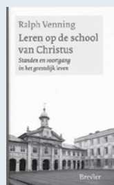
Uit: "Leren op de school van Christus", Ralph Venning (uitg. Brevier).

Dan kunt u nog bekeerd worden op grond van het werk van Christus. Hij leeft. En Hij leert wat het betekent om als een dode zondaar het leven te ontvangen uit Hem. Bid om levendmaking uit uw doodstaat. En het blijve de bede van een strijdend volk: 'O HEERE, maak mij levend om Uws Naams wil' (Ps. 143:11, zie kanttekening 31-33).