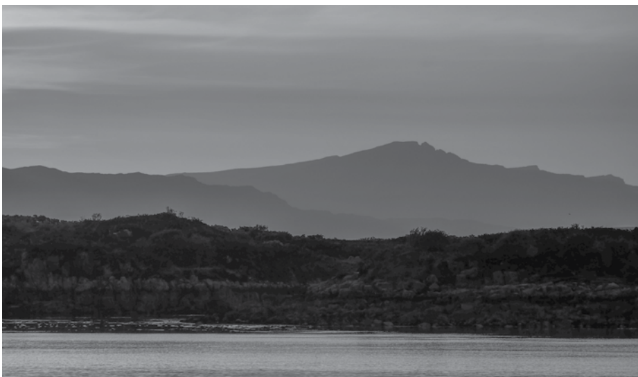
'O, dat de schaduwen en de nacht voorbij waren.'

Rutherford's boodschap is gebleven: 'O, dat Christus het deksel wegnam, het gordijn van de tijd opzieschoof, dat Hij de hemelen scheurde en nederkwam. O, dat de schaduwen en de nacht voorbij waren, dat de dag aanbrak en dat Hij Die onder de leliën weidt, tot Zijn hemelse trompetters riep: 'Maak u gereed, laten wij nederdalen, de vier hoeken van de wereld samenvouwen en trouwen met de bruid'.