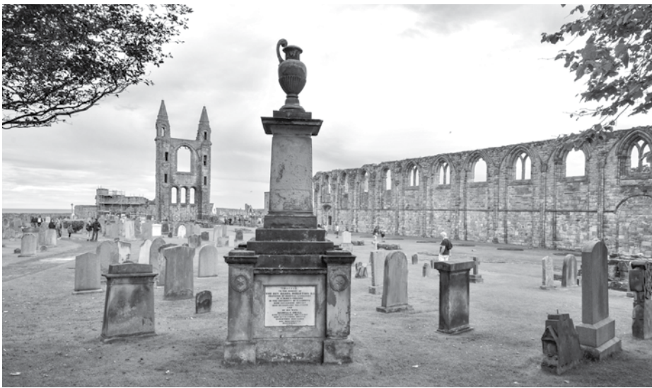
Op het kerkhof van St. Andrews liggen Samuel Rutherford en Thomas Halyburton begraven.