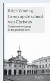
Uit: "Leren op de school van Christus", Ralph Venning (uitg. Brevier).