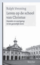
Uit: "Leren op de school van Christus", Ralph Venning (uitg. Brevier).