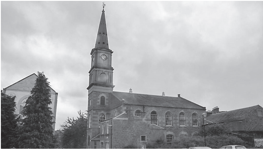
De St. Peter's Church wordt tot 'een plaats des geweens'.