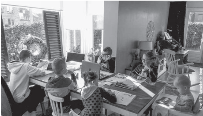
Deputaatschap KGJO werkgroep gezin

Bent u al weer een beetje gewend? Die vraag heeft u als vader of moeder de afgelopen tijd vast vaker gekregen. En misschien hééft u uw draai alweer gevonden. Gelukkig! Toch?