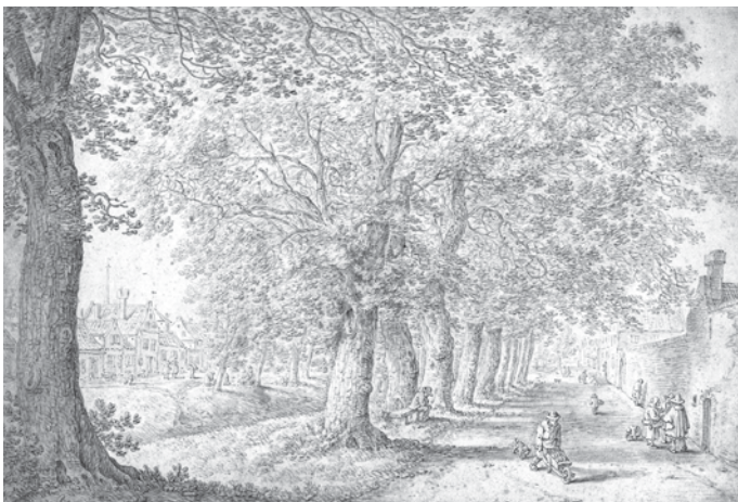
Herman Saftleven (1619-1685) - Gezicht op Onder de Linden.