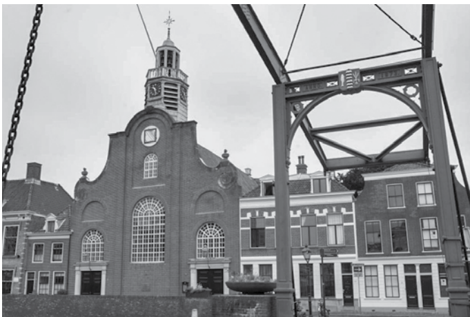
Pelgrimvaarderskerk te Rotterdam.

Het was in juli 1620, nu dus bijna 400 jaar geleden, dat een wonderlijk gezelschap te scheep ging in Delfshaven, onder de rook van Rotterdam. Aan hun spraak te horen ging het om Engelsen.