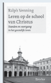
Uit: "Leren op de school van Christus", Ralph Venning (uitg. Brevier).