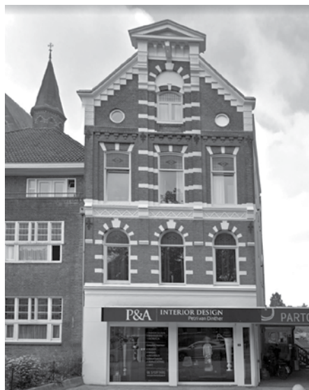
Van 1948 tot 1969 werden de kerkdiensten gehouden op Berg en Dalseweg 38.

In Nijmegen waren de protestants-christelijke scholen al behoorlijk verwaterd. De gelijkenis van de verloren zoon werd in een 'geactualiseerde' versie verteld: een nozemachtig type op een Harley Davidson raakte tijdens een kroegentocht aan lager wal. Later heb ik het als een groot gemis er-