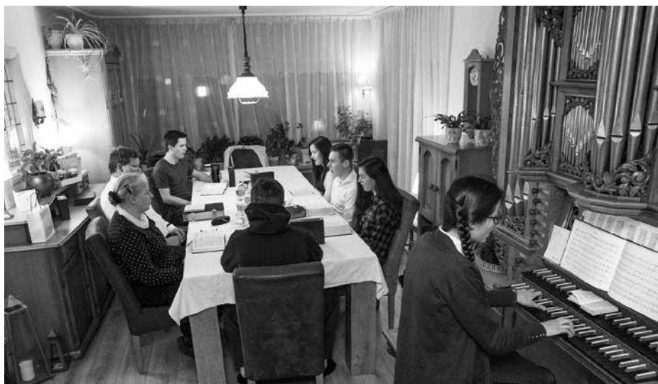
De liederen Sions hebben zo veel waarde.

In deze lijn hebben we in het begin van de coronacrisis opgeroepen tot respect voor de overheid en voor de noodzakelijke maatregelen, ons ten goede. In een latere fase klonk vanuit ditzelfde geloofsartikel het appel tot bewustzijn van de overheid om met meer zorg oog te hebben voor het levensbelang van 'de heilige kerkdienst'. Samen komen, samen zingen, samen bidden, samen luisteren. We kunnen en willen niet zonder! Dit is de ademhaling van 'de vergadering van de ware Christgelovigen' (NGB, artikel 27). Dit samen-komen mogen we en willen we naar de apostolische vermaning niet anders dan alleen bij bittere noodzaak nalaten (Hebr. 10:25), want dit nalaten heeft ernstige geestelijke gevolgen. Het rustdaggebed roept ons duidelijk op om 'tot de gemeente Gods naarstig te komen'