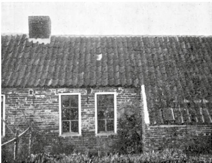
Het armenhuis in Garmerwolde.