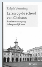
Uit: "Leren op de school van Christus", Ralph Venning (uitg. Brevier).

Wie is deze Middelaar? De Zone Gods, in de menselijke natuur gekomen. De Heere Jezus Christus. Hij Die van eeuwigheid Zich gaf en in de tijd overgaf in de Godsverlating. Zijn komst en diepe vernedering zo bereid en gewillig ondergaan. Opdat godverlaters en goddelozen in de gemeenschap met God gebracht zouden worden. Zielsverootmoedigend wonder! Dat een hater van God Zijn gunst mag proeven in Hem, de Heere Jezus Christus. Dit leven geeft rust, kracht, en wederliefde! Hier komt God aan Zijn eer en de ziel aan de zaligheid.