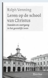
Uit: "Leren op de school van Christus", Ralph Venning (uitg. Brevier).