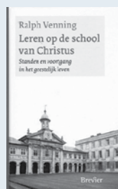
Uit: "Leren op de school van Christus", Ralph Venning (uitg. Brevier).