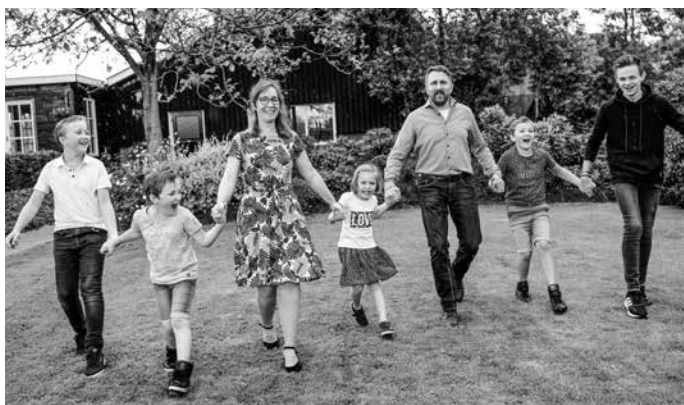
Pleegzorggezin Bronkhorst uit Uddel.

De nood in deze wereld is groot. Christelijke organisaties en individuele christenen zetten zich in voor zendingswerk en hulpverlening. Echter ook dichter bij huis is genoeg te doen. Thuis kunnen christelijke gezinnen tot zegen zijn voor kinderen in de knel.