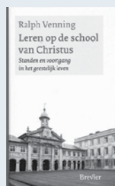
Uit: "Leren op de school van Christus", Ralph Venning (uitg. Brevier).