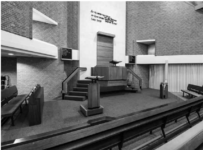
Bethaniëkerk Den Haag

"Hoven in de Hofstad", geschiedenis van de Gereformeerde Gemeenten van Den Haag en Scheveningen (1982-2017); F.J. de Kok, uitg. De Banier, 2020.