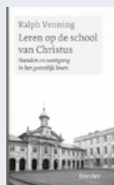
Uit: "Leren op de school van Christus", Ralph Venning (uitg. Brevier).