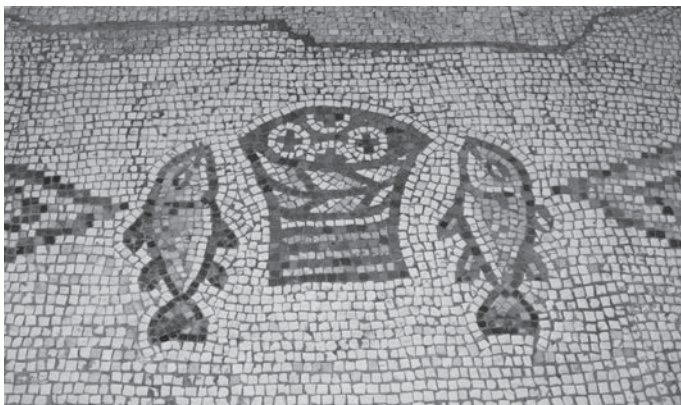
Vijf broden en twee vissen.

Er is onder protestanten een trend gaande om te vasten in de zogenoemde veertigdagentijd.