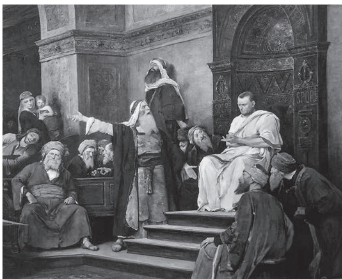
... Die geleden heeft onder Pontius Pilatus.

Voor het antwoord daarop gaan we terug naar de laatste dagen van het leven van de Heere Jezus op aarde. De Middelaar werd gevangen genomen in de hof van Gethsémané en naar de hogepriester gebracht. Daar hebben ze bedacht waarom Hij gedood moest worden. Daarna is Hij naar stadhouders Pontius Pilatus gebracht.