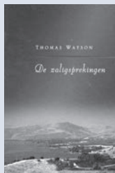
Uit: "De zaligsprekingen", Thomas Watson (uitg. Den Hertog).

Ik maak onderscheid tussen 'arm' in de zin van het Evangelie, en 'arm' in de zin van de pausgezinden. De pausgezinden maken een verkeerde kanttekening bij deze tekst. Onder 'arm van geest' verstaan zij degenen die afstand doen van hun bezit en een gelofte tot vrijwillige armoede afleggen, en teruggetrokken in hun kloosters leven. Christus heeft dit echter nooit bedoeld. Hij spreekt niet diegenen zalig die zichzelf arm maken, die hun bezit en hun beroep opgeven, maar diegenen die in de zin van het Evangelie arm zijn. Welnu dan, wat hebben we onder 'arm van geest' te verstaan? Het Griekse woord voor 'arm' wordt niet alleen in strikte zin genomen voor degenen die van aalmoezen leven, maar ook in bredere zin voor degenen die zowel innerlijk als naar het uitwendige van aangename dingen verstoken zijn. Dan duidt 'arm van geest' diegenen aan die ertoe gebracht zijn dat ze hun zonden gaan beseffen, die niets goeds in zichzelf zien, die aan zichzelf wanhopen en enkel en alleen smeken om de genade van God in Christus.