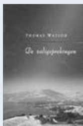
Uit: "De zaligspreekingen", Thomas Watson (uitg. Den Hertog).